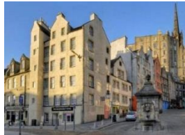
The Grassmarket Hotel, Edinburgh